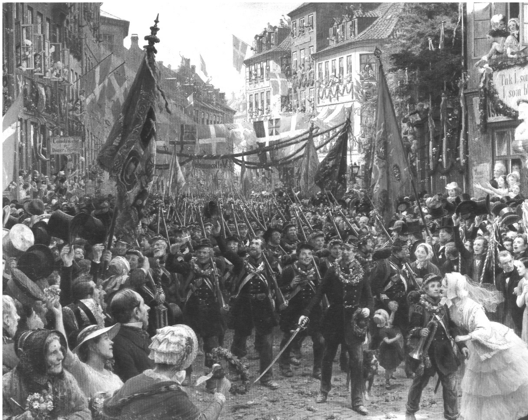
Maleriet i stuen på Svanevang - „Danske soldaters hjemkomst i 1849“